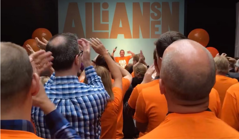
Den mimetiska krisen var närmast total på alliansens valkickoff 2014.