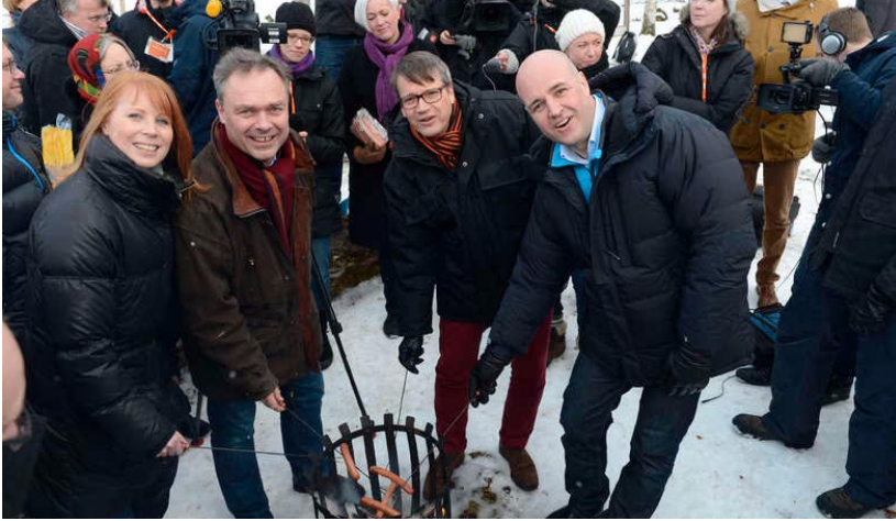
Alliansen grillar korv i Maramö, omringade av fotografer.