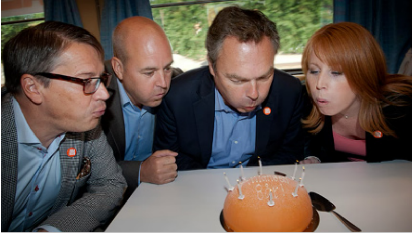
Alliansens ledare blåser ut ljus under en tågresa 2012.

Alliansen åtta år vilket visades upp under en tågresa mellan Stockholm och Linköping. Prinsessstårta i alliansens orangea färg stod på menyn. Samtidigt presenterades en stor infrastruktursatsning på järnvägen.