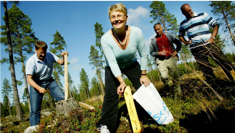
Maud Olofsson, Lars Leijonborg, Göran Hägglund och Fredrik Reinfeldt planterar träd. Dagens Nyheter 2017-01-19